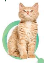
ANIMALE DE COMPANIE