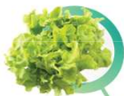
LEGUME ȘI FRUCTE NESPĂLATE

Spală bine fructele și legumele, bea apă din surse sigure, spală-te bine pe mâini de fiecare dată după ce ai intrat în contact cu suprafețe posibil infectate sau cu animale de companie.